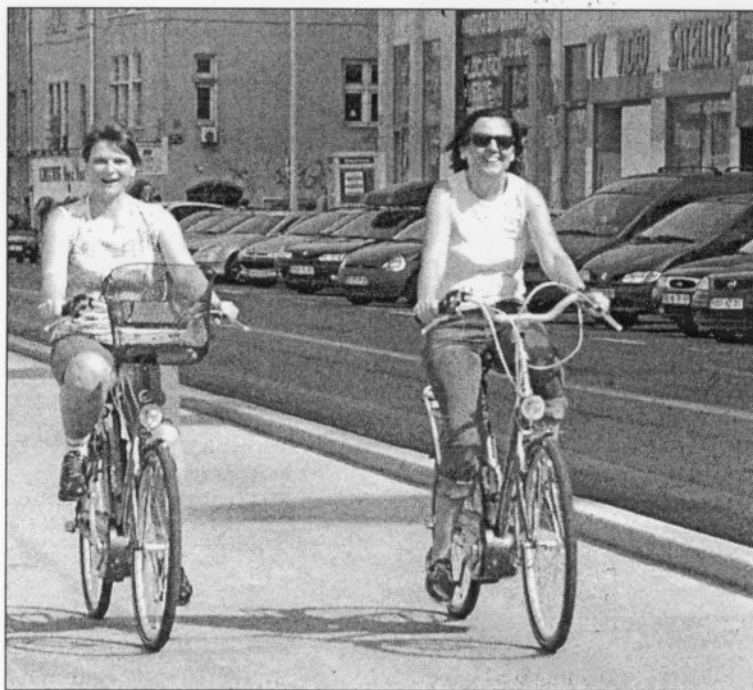
En vélo électrique, on avale facilement les grimpettes

Tout savoir su Vélo'v: www.velov.grandlyon.com/